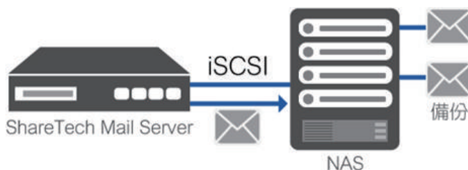
以儲存裝置取代主硬碟

台中總公司 04-2705-0888 台中市西屯區西屯路二段256巷6號3F-6