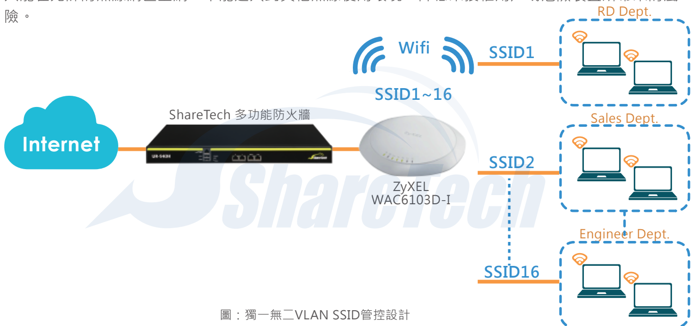
圖：獨一無二VLAN SSID管控設計

對連鎖零售業來說，如何對營業據點內的網路環境做有效的管控，提供顧客一個安全無線使用空間是非常重要的。通常企業對於員工上網都有一定規範制度，但是對於客戶無線上網行為卻不能全面禁止，眾至多功能UTM提供VLAN SSID管控能力，可以區隔每個無線使用環境，一旦訪客通過認證後，只能在允許的無線網區上網，不能進入到其他無線使用環境，降低未授權用戶或危險裝置所帶來的風險。