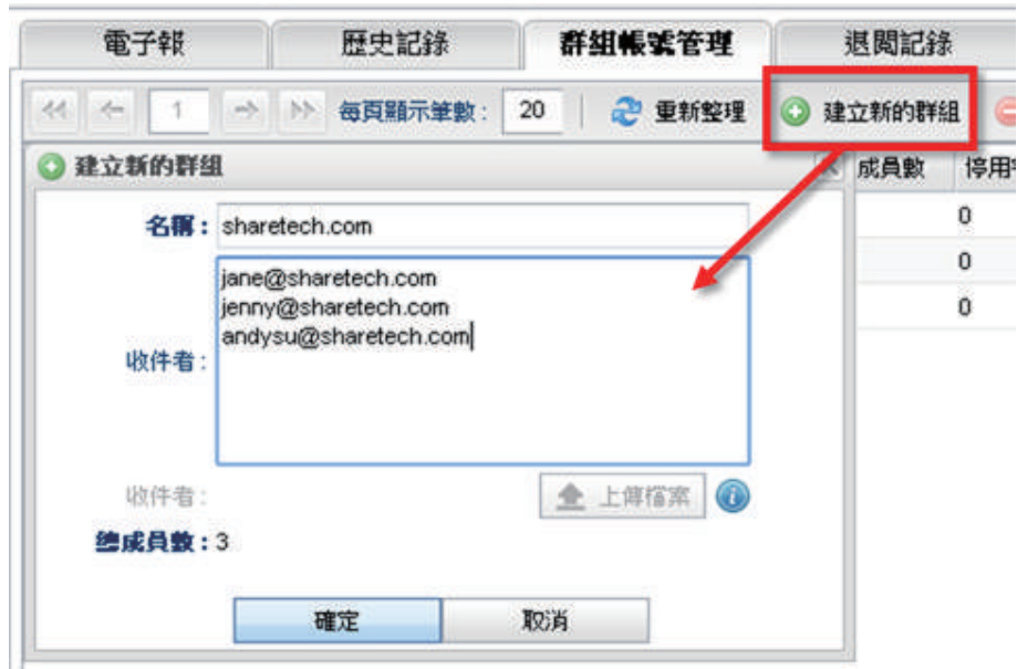
圖一：建立電子報的收件者群組